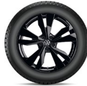
VW Loen Schwarz