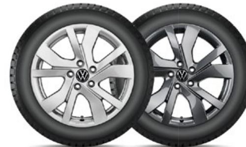
VW Rockingham Silber

VW Huntsville Silber für den neuen Tiguan in 19" mit 235/50 R19 103V XL Bridgestone Blizzak LM005 statt 3.600,- mit TopCard 2.700,- KE: C | NHK: A | GE: 72 | GE/G: B | SK-F: Nein Art.-Nr. 2355019HV40005