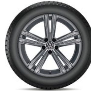
VW Sebring Grau