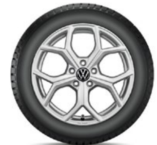
VW Huntsville Silber

Alle abgebildeten Winterkomplettäder (WKR) für den neuen Tiguan haben keine Reifendruckkontroll-Sensoren (RDKS). Falls Ihre Fahrzeugausstattung dies erfordert, sind WKR mit RDKS zu wählen. Beachten Sie bitte den Aufpreis. Ihr Volkswagen Service-Betrieb informiert Sie gerne.